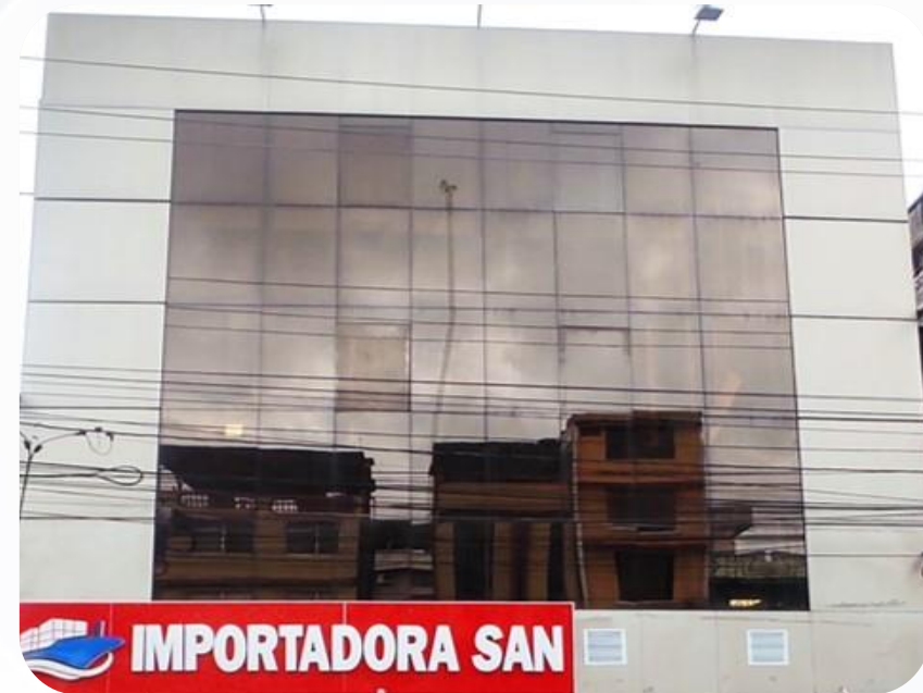
UNIDAD JUDICIAL MULTICOMPETENTE PENAL Y UNIDAD JUDICIAL CIVIL CON SEDE EN EL CANTÓN VENTANAS